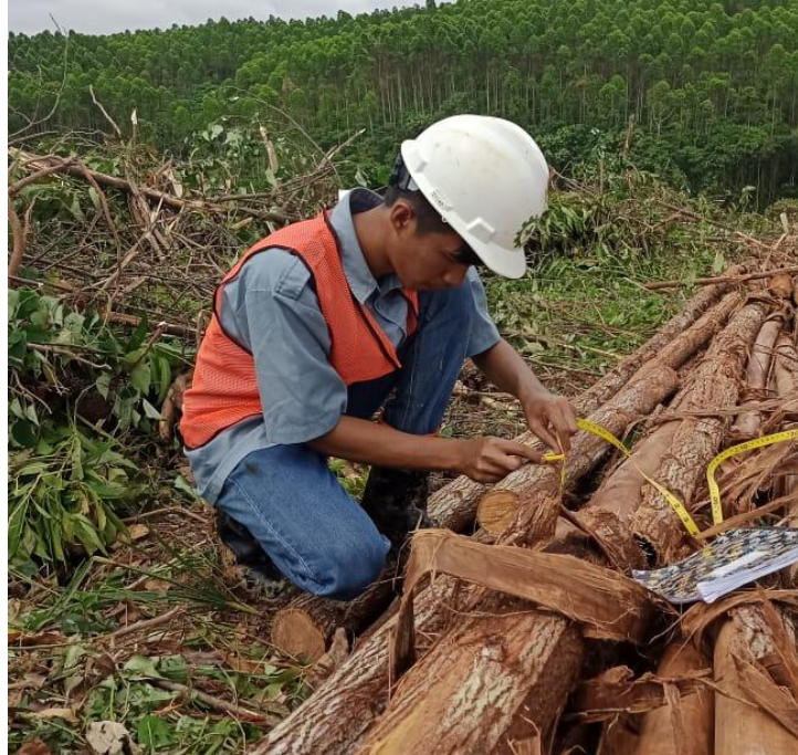
Lampiran 9. Gambar Pengukuran Keliling Pangkal, Keliling Ujung dan Panjang log