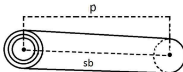
Gambar 2. Mengukur Panjang Log

Pengukuran panjang log dilakukan dengan cara meletakkan badan log sejajar dengan sumbu log , dapat dilihat pada gambar 2 (Standar Nasional Indonesia, 2021).